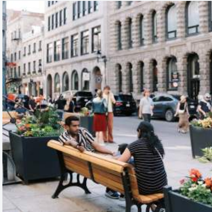
MISE EN VALEUR DU TERRITOIRE