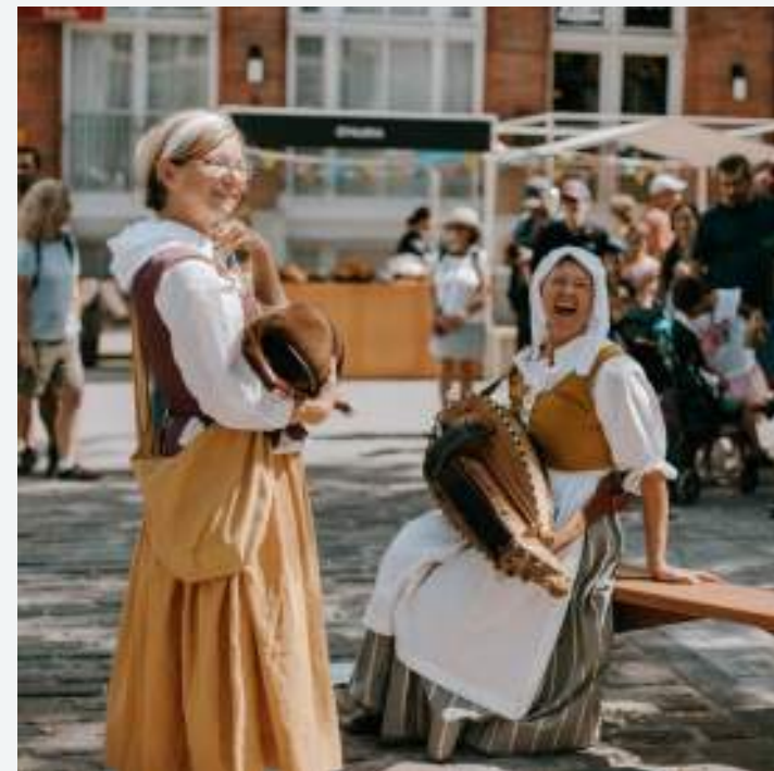
SOUTIEN À L'ANIMATION