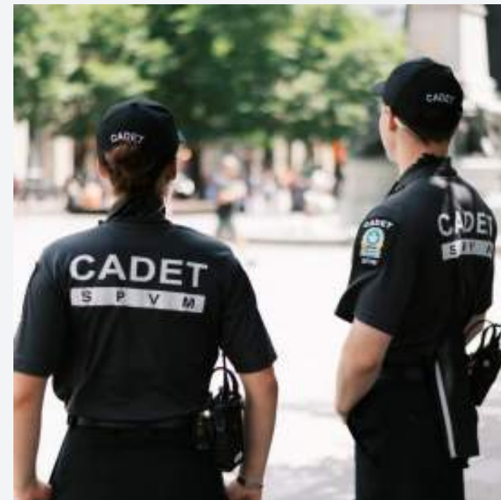
VIE DE QUARTIER & SÉCURITÉ PUBLIQUE