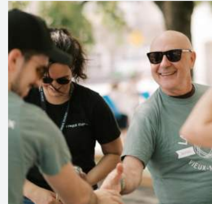
MAILLAGE & BON VOISINAGE