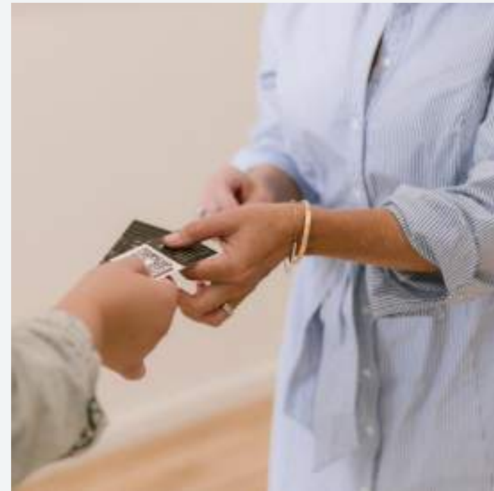
SERVICE AUX ENTREPRISES